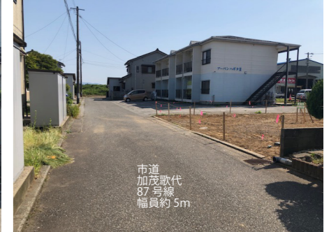
市道 加茂歌代 87号線 幅員約5m