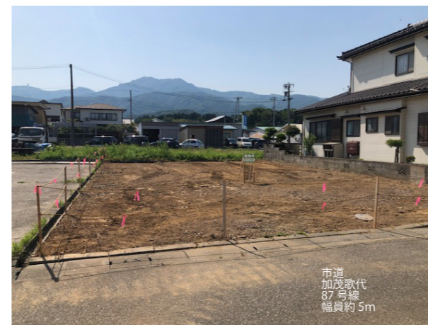
市道 加茂歌代 87号線 幅員約5m