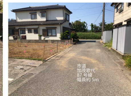
市道 加茂歌代 87号線 幅員約5m