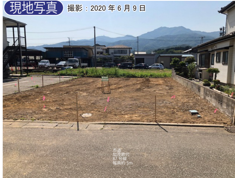
市道 加茂歌代 87号線 幅員約5m