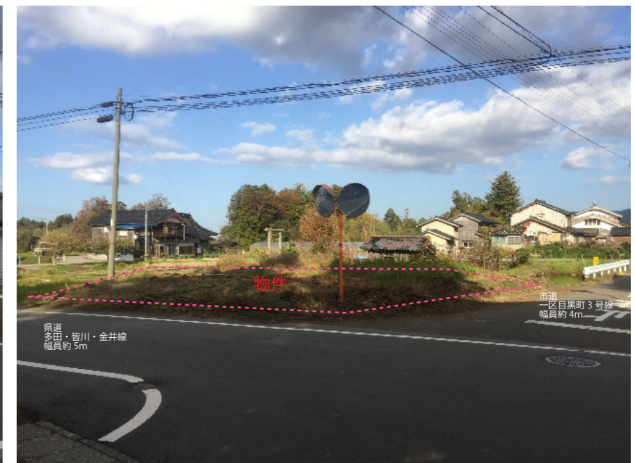
現地写真 撮影：2018年10月25日